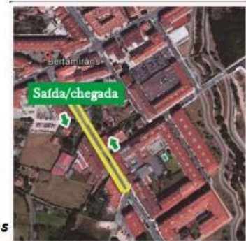
* Percorrido de 350 metros