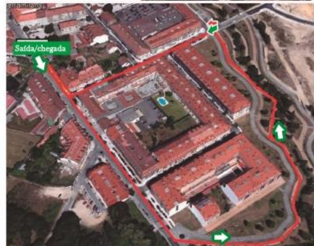
* Percorrido de 1000 metros